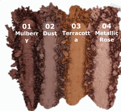
Rosé Renaissance 02

Modernit värikonseptit: lämpimät, kylmät, leikkisät ja hillityt värit. Jokaiselle ihonsävylle ja tilaisuuteen!