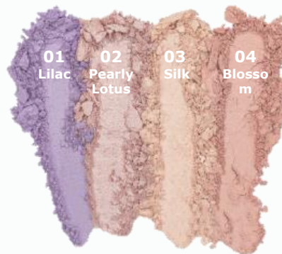
Pure Pastels 01