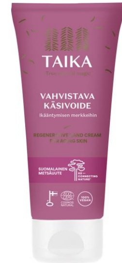
TAIKA Vahvistava käsivoide 60ml