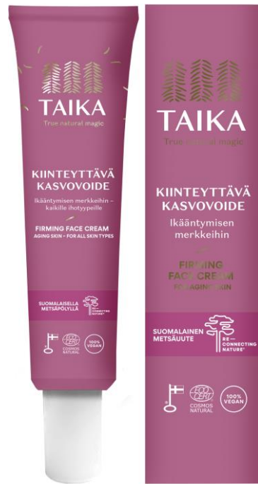
TAIKA Kiinteyttävä kasvoivoide 50ml